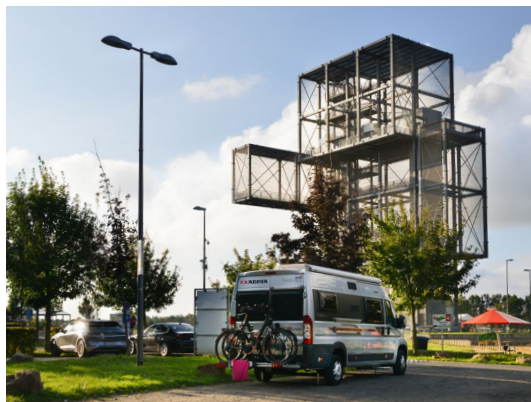
Stellplatz auf der Goltsteinkuppe

Zu Füßen des Aussichtsturms Indemann auf der Goltsteinkuppe gibt es zwei Stellplätze für Wohnmobile. Ein gastronomischer Betrieb mit Panorama-Terrasse, ein großer Abenteuerspielplatz, eine Minigolf- und eine Fußballgolfanlage befinden sich in direkter Nachbarschaft.