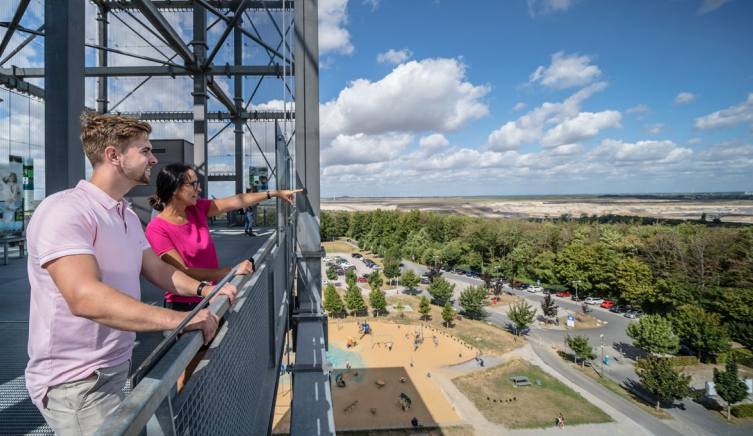
Blick in die Zukunft: Aussichtsturm Indemann, Inden