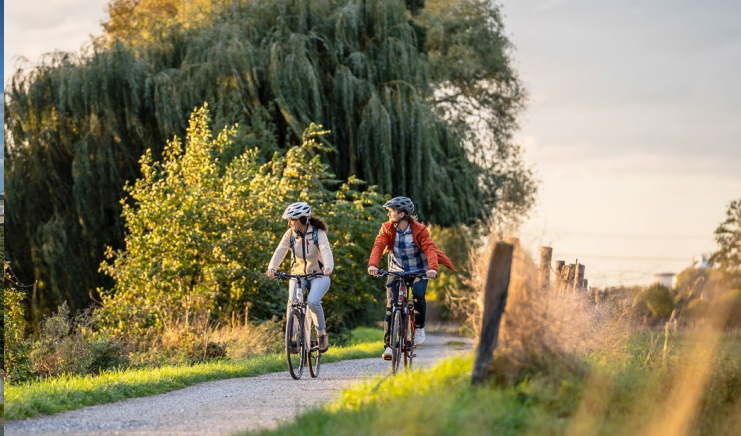
Entspannung pur: RurUfer-Radweg und Wasserburgen-Route