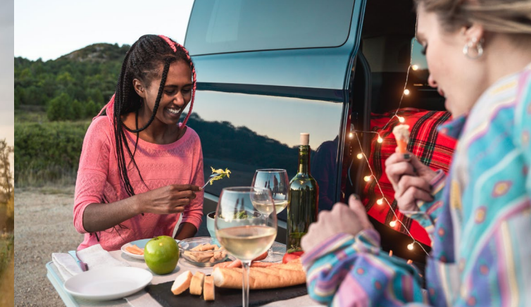
Genuss für alle Sinne: das indeland entdecken und erleben