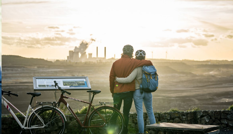
Abendstimmung am Tagebau, Inden-Schophoven